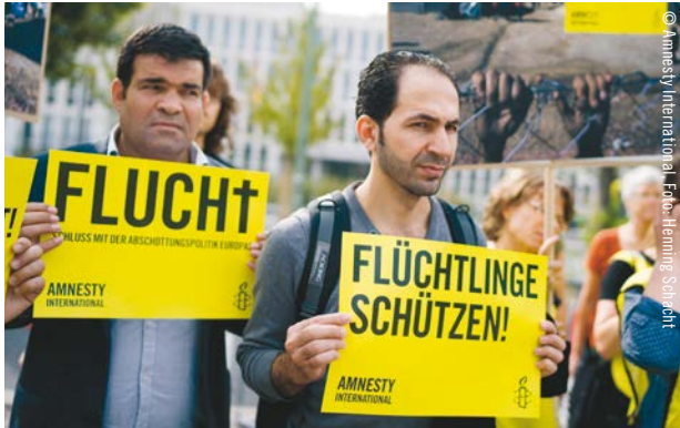
Amnesty-Aktion für einen besseren Schutz von Flüchtlingen im September 2015 in Berlin.

Deutschland nimmt seit dem Jahr 2012 am Resettlement-Programm des UNHCR teil. Zunächst wurden hier jährlich nur 300 Flüchtlinge neu angesiedelt. Die Bundesregierung hat zugesagt, dass 2018 und 2019 insgesamt 10.200 besonders schutzbedürftigen Flüchtlingen hier eine Chance auf einen Neuanfang gegeben wird im Zuge des Resettlements oder der humanitären Aufnahme.