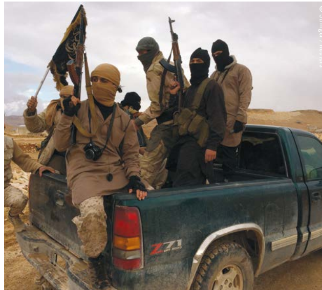
In Syrien und in anderen Ländern richtet sich die Gewalt von bewaffneten Gruppen und Militär oft gegen Zivilpersonen. Vielen Menschen bleibt daher nichts anderes übrig, als vor den Kämpfen zu fliehen.