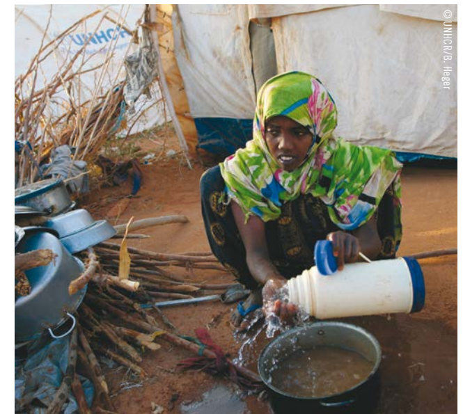
Im Flüchtlingslager Dadaab in Kenia haben viele Menschen aus Somalia Zuflucht gefunden. Aufgrund der Überbelegung und mangelnder sanitärer Anlagen brechen immer wieder Cholera-Epidemien aus.

Nach Angaben des UNHCR benötigen derzeit 1,4 Millionen Menschen weltweit einen Neuansiedlungsplatz – Tendenz steigend. Die bereitgestellten Plätze bleiben seit Jahren weit hinter dem Bedarf zurück. So konnten 2018 nur knapp 57.000 Menschen in einem Aufnahmeland neu angesiedelt werden. Die Mehrzahl der Plätze stellten die USA, Kanada und Großbritannien. Die Europäische Union hat für alle Mitgliedstaaten 50.000 Resettlement-Plätze bis Ende 2019 zugesagt. Doch angesichts des hohen Bedarfs reicht dies bei Weitem nicht aus.